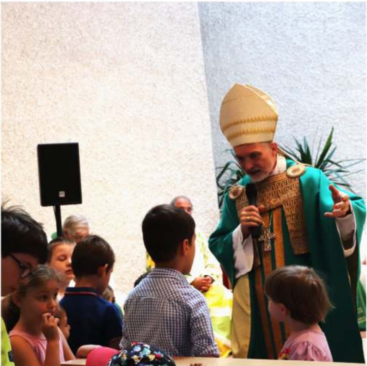
Pfarrfest am 18. Juni 2023 mit Bischof G.M. Hanke

Gaulnhofen - Herpersdorf - Pillenreuth - Weiherhaus - Worzeldorf Jhrg. 13 / 2023 / Nr. 3 An der Radrunde 155, 90455 Nürnberg