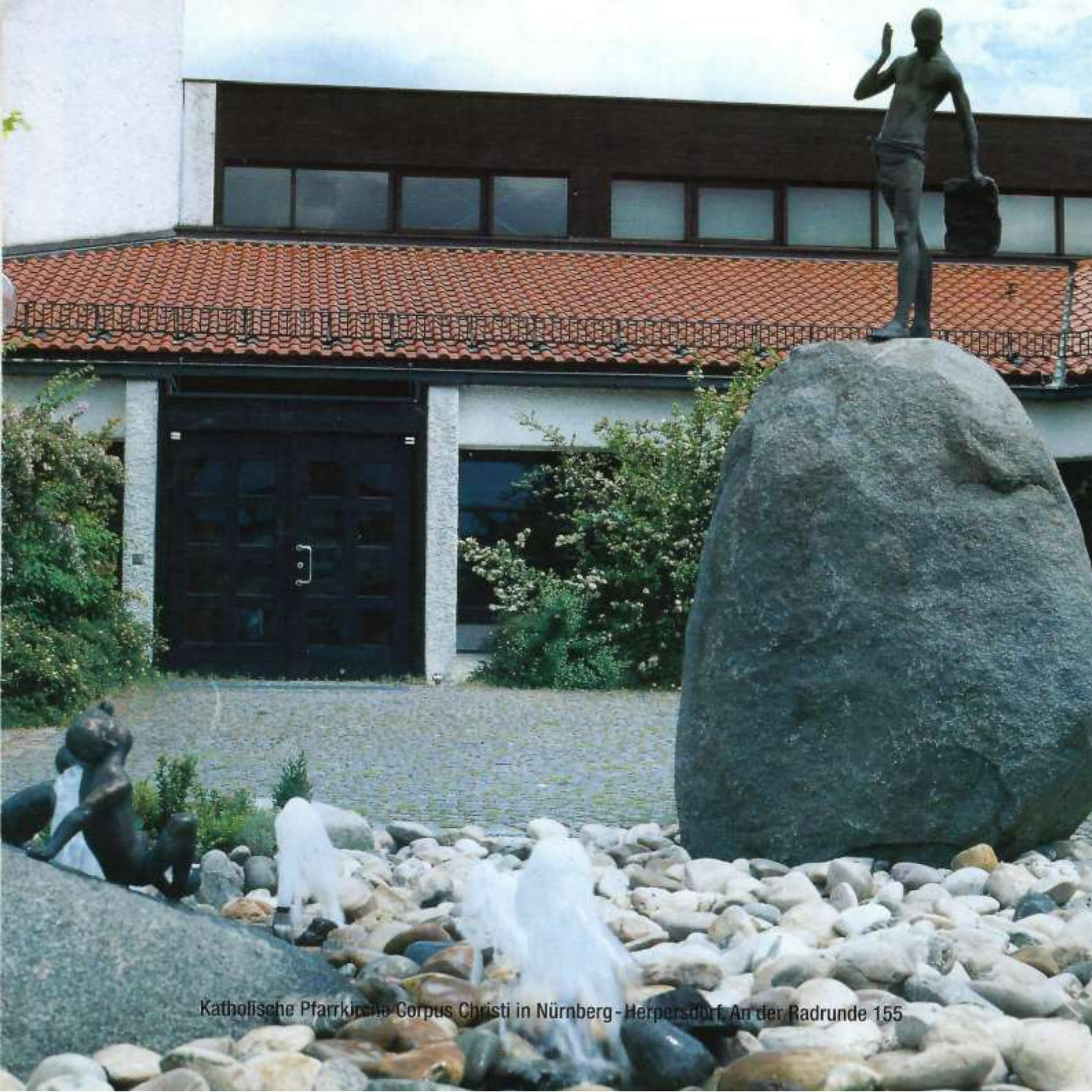
Katholische Pfarrkirche Corpus Christi in Nürnberg - Herpersdorf, An der Radrunde 155