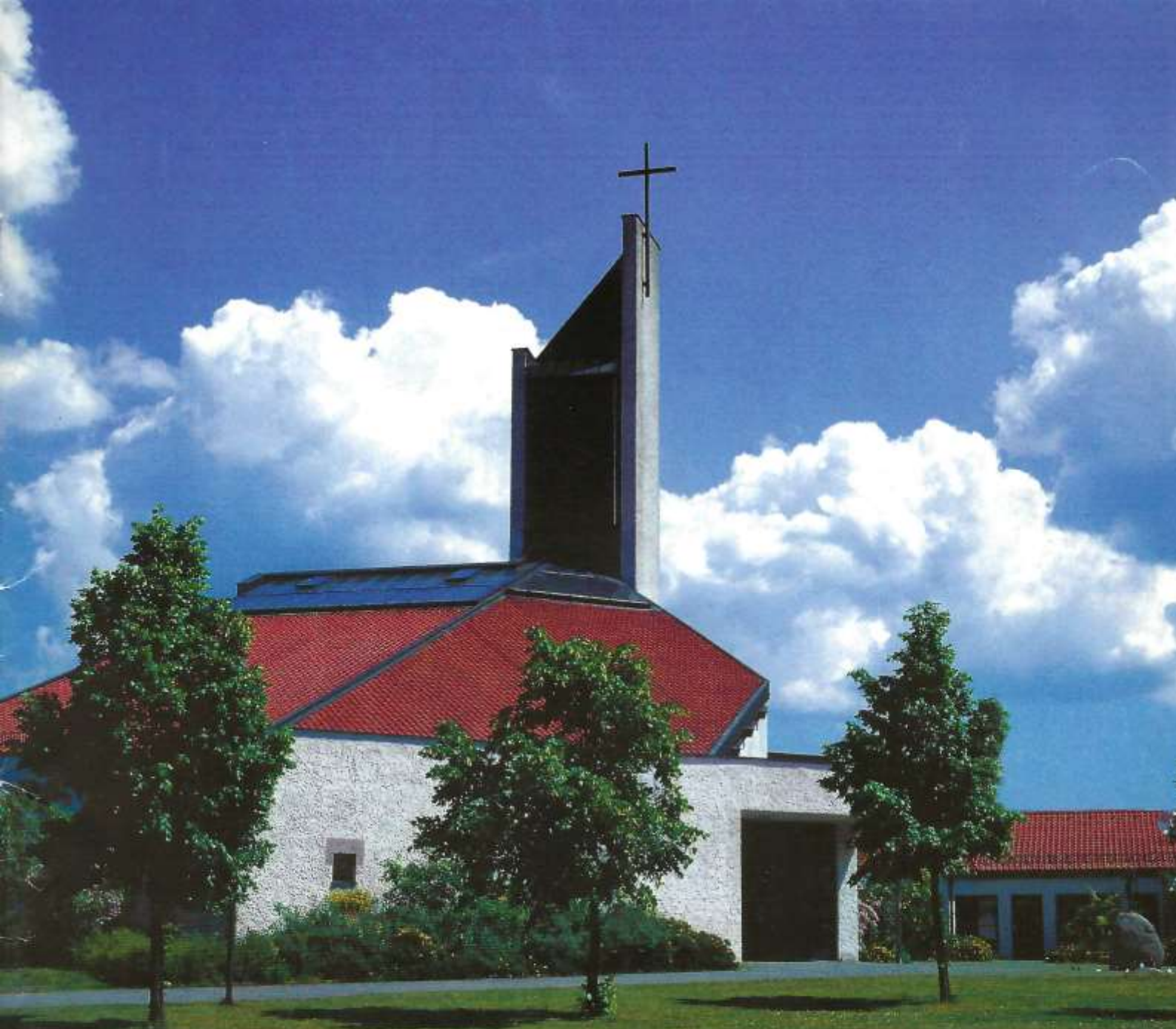
Corpus Christi · Nürnberg - Herpersdorf